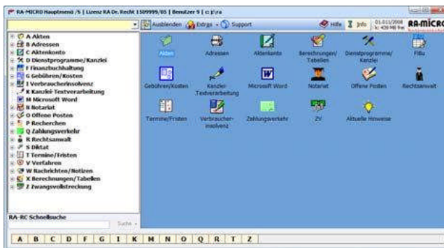
Der ra-micro 7 Personal Desktop (PD)

Per „Drag & Drop“ können Programmfunktionen aus dem „Programmbaum“ links in den rechten Bereich des „Personal Desktops“ (PD), den „Programmdesk“, gezogen werden. Häufig genutzte Programmfunktionen können so individuell im Programmdesk zusammengestellt werden.